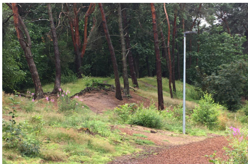
bestaande zandrug Dommelhof