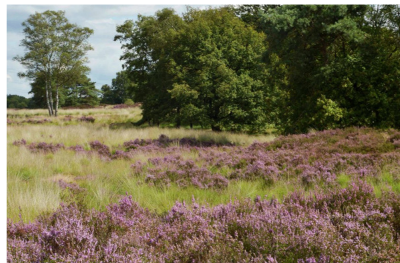
toekomstig hersteld heidelandschap