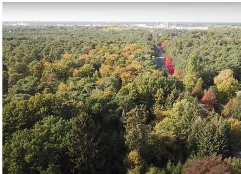
vogelperspectief loofbos (links van de Haagdoordijk)