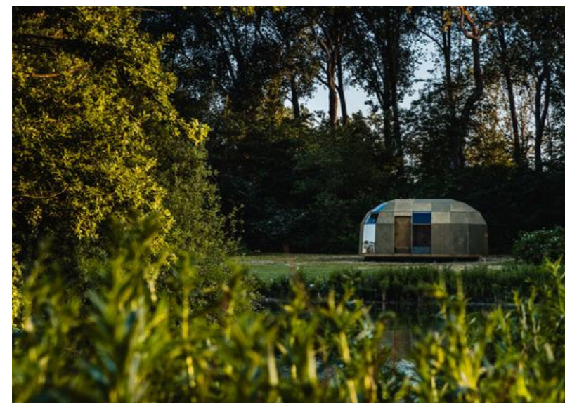
lichte recreatieve verblijven