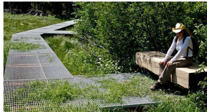
knuppelpaden (met metalen roosters)