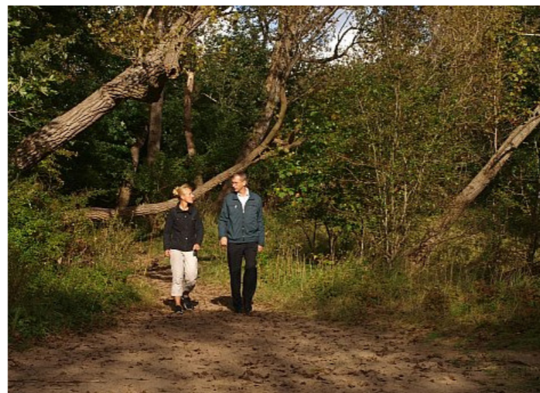
wandelen in het bos