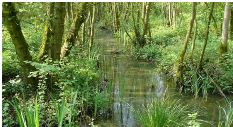
overstromingsgevoelig gebied vandaag