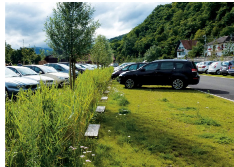
aanleg groene parking

Projecttype: beheersplan en potentiële inplanting bebouwing