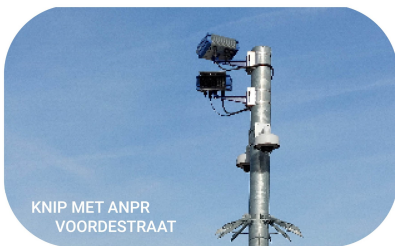
KNIP MET ANPR VOORDESTRAAT

In de Molenstraat wordt geopteerd voor een fietsstraat hetzij tijdelijk tijdens de school hetzij permanent. Na evaluatie kan bekeken worden of er ook in de Molenstraat verdere maatregelen nodig zijn om de schoolgaande jeugd maximaal te beschermen.