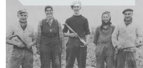
Seizoenarbeiders poseren in het veld tijdens de bietenoogst

Niet iedereen vertrok permanent. Heel wat Vlaamse seizoenarbeiders hielpen in de zomermaanden met de graan- en bietenoogsten in Frankrijk en Wallonië.