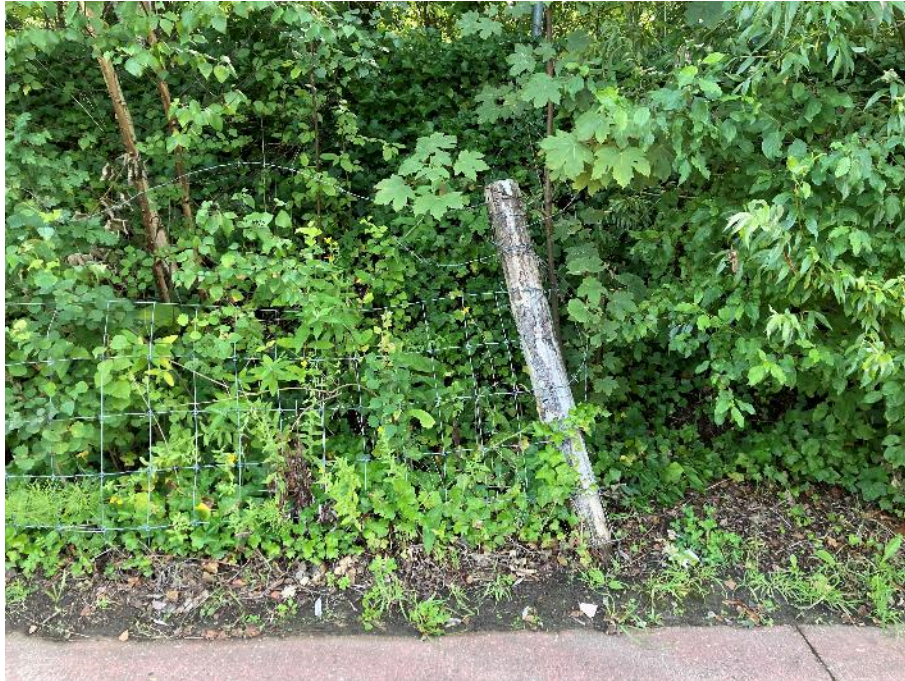
Foto 18: Omgevallen paal ter hoogte van de kruising van de kapelstraat en bosstraat