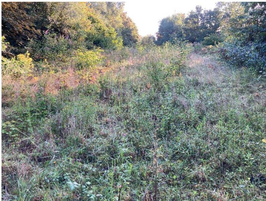
Foto 3: 'Overwoekerde' erosiegeul op de helling naar de stortplaats